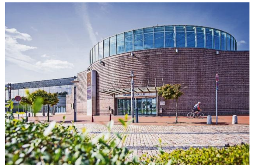
Eine Sanierung der Stadthalle soll angeblich mit 60 Millionen Euro zu Buche schlagen. Ist ein Neubau günstiger?

Im Vorfeld der Aufsichtsratsitzung war die Summe von 60 Millionen Euro kolportiert worden, die aufgerufen werden muss. Neuhoff nahm zu Summen keine Stellung.